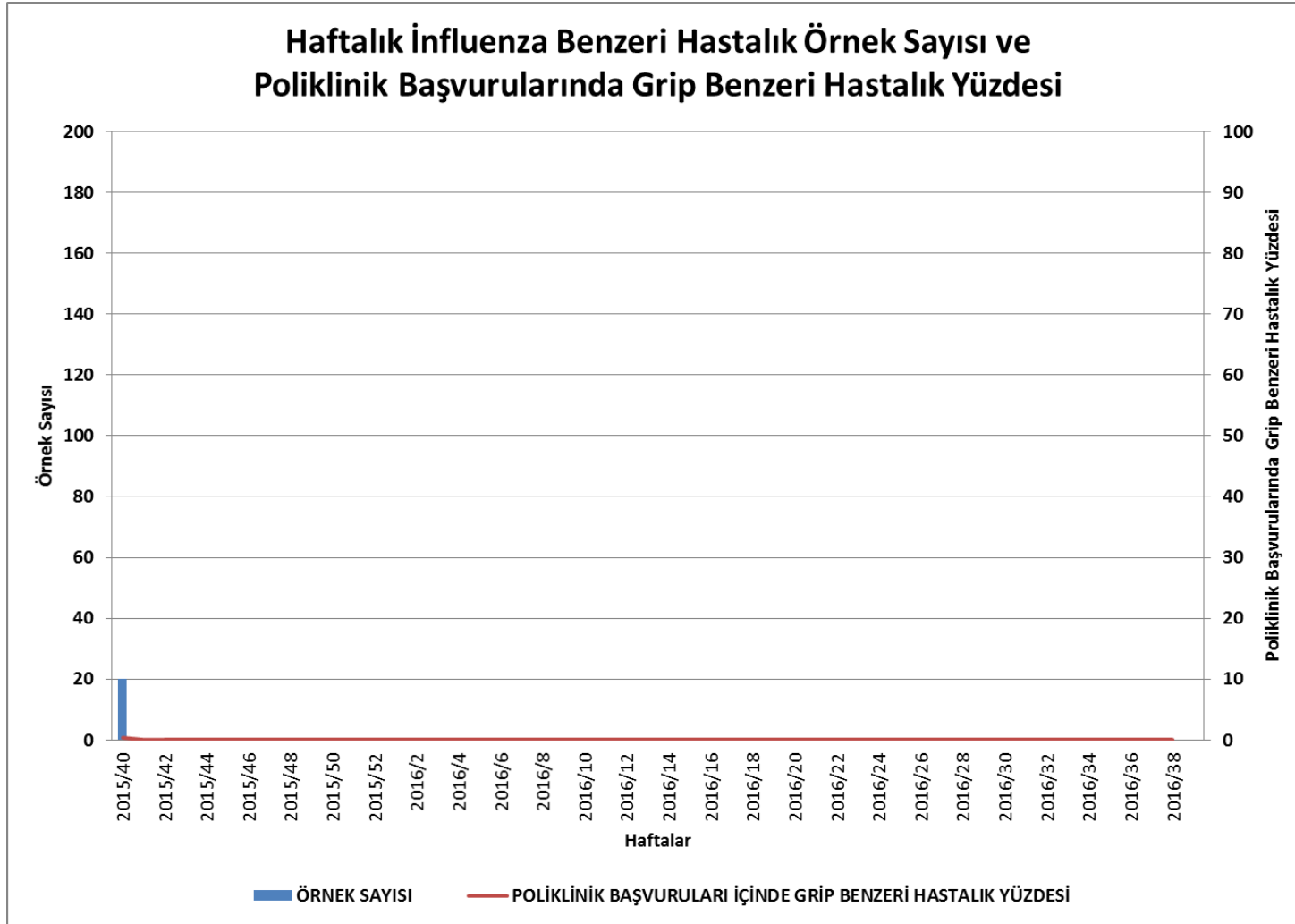
Grafik-1: Ülkemizde sentinel influenza sürveyansı kapsamında haftalık çalışılan Grip Benzeri Hastalık (GBH/ILI) örnek sayısı ve poliklinik başvuruları içerisinde Grip Benzeri Hastalık yüzdesi.